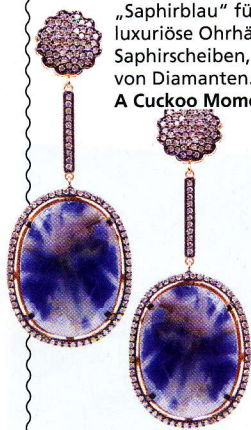
„Saphirblau“ für Erwachsene: luxuriöse Ohrhänger mit Saphirscheiben, eingerahmt von Diamanten. Von A Cuckoo Moment