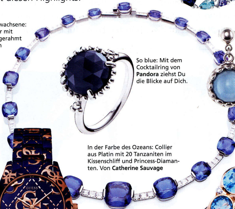
So blue: Mit dem Cocktailring von Pandora ziehst Du die Blicke auf Dich.