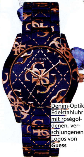
Denim-Optik: Edeltahluhr mit roségoldenen, verschlungenen Logos von Guess