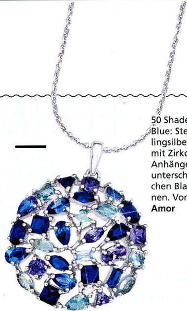
50 Shades of Blue: Sterlingsilberkette mit Zirkonia-Anhänger in unterschiedlichen Blautönen. Von Amor

Traditionell sollte jede Braut am Tag ihrer Hochzeit einen Gegenstand in der Farbe Blau bei sich tragen. Kein Problem mit diesen Highlights.