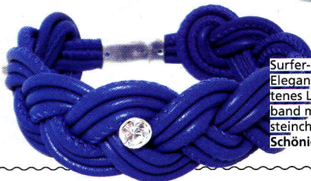
Surfer-Style trifft Eleganz: geflochtenes Lederarmband mit Glitzersteinchen von Schöniglich