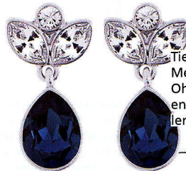
Tiefblau wie das Meer: rhodinierte Ohrstecker mit blauen und klaren Kristallen von Swarovski